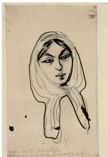
Charles BAUDELAIRE (1821-1867) Portrait de Jeanne Duval Mine de plomb, encre et plume 13,5 x 8 cm Prix réalisé : 40 300 €