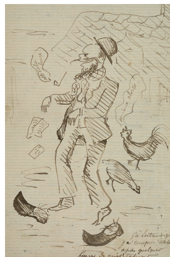
Paul VERLAINE (1844-1896) Cellulairement Manuscrit autographe de 32 poèmes Prix réalisé : 214 500 €