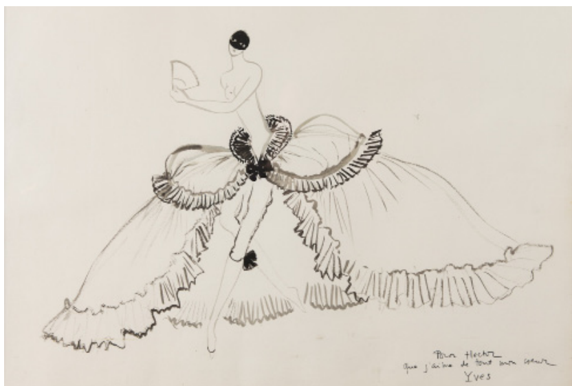
Yves SAINT LAURENT (1936-2008)