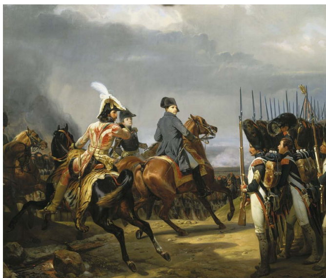
Horace Vernet, La Bataille d'Iéna , 4 octobre 1806