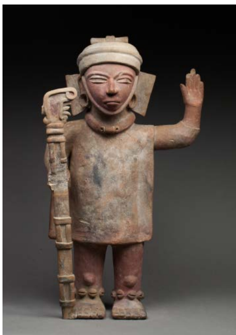
Terre cuite avec traces de polychromie ce qui est rare sur les œuvres du Veracruz, Mexique, époque Classique, 650 à 950 après J.C. 61 x 38 cm Estimation : 20 000 - 30 000 €

Itzamna est le dieu créateur aux multiples aspects et le premier du panthéon maya. Son totem est le serpent et son nom, en langue maya Itzamna, signifie la « maison du reptile ». Dans la cosmogonie maya, le serpent est le symbole du ciel, de la terre et de l'inframonde. Itzamna est la personnification de toutes ces forces et il forme une entité unique représentant chacune d'elles. Le culte du dieu créateur est lié au pouvoir des dynasties régnantes dont il est le plus grand protecteur. À l'occasion de la nouvelle année du calendrier maya, de nombreuses cérémonies lui sont dédiées et il est invoqué pour éloigner dangers et calamités. Il est toujours bénéfique et à la différence des autres dieux son image n'est jamais associée à la mort ou à la guerre. À la fin de la période classique, les peintures représentent Itzamna sous les traits d'un scribe. Sur les codex, il apparaît comme un seigneur doté de magnifiques attributs sacerdotaux (comme dans cette œuvre). Les témoignages sur la religion maya à l'époque Post-Classique décrivent Itzamna comme le premier prêtre de l'humanité et l'inventeur de l'écriture. Il n'est donc pas étonnant que les seigneurs possédant les qualités de prêtre, scribe et peintre aient fait d'Itzamna leur divinité principale et patron de leur art d'exercer et de transmettre le pouvoir.