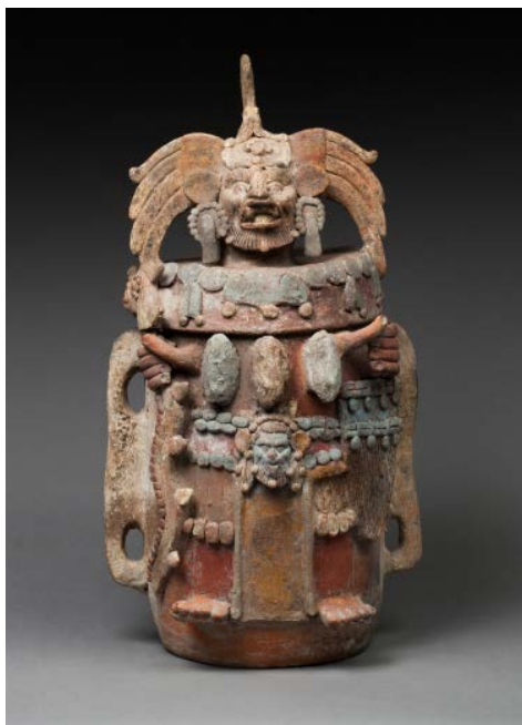
Maya, état de Quiché, Guatemala, période Classique 550 à 950 après J.C. 59 x 32 cm Estimation : 70 000 -90 000 €

Ce réceptacle cultuel présentant le dieu Itzamna arbore les traits du dieu Chauve Souris et il tient dans une de ses mains un serpent ondulant personnifiant le dieu Kukulkan. Il est vêtu d'un pectoral figurant un félin stylisé sur le torse et trois amulettes en forme de fève de cacao sur le ventre (le chocolat étant la boisson sacrée des seigneurs chez les Mayas). Son visage est dirigé avec intensité vers le ciel dont il est le maître et créateur. Terre cuite ayant conservé en partie sa magnifique polychromie d'origine.