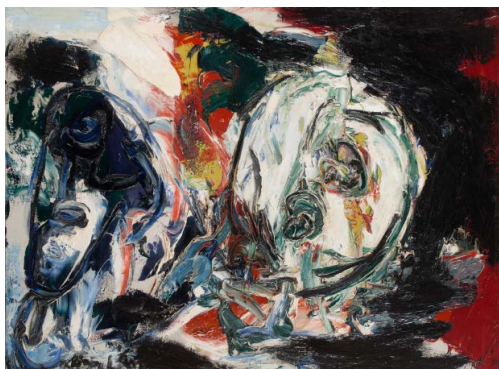
Karel APPEL (1866-1937) Deux têtes (Two heads, white and blue) Huile sur toile. Estimation : 60 000 - 80 000 €

Puis les signatures d' Henri Martin (1860-1943) , Jean Helion (1904-1987) , André Masson (1896-1987) , Victor Brauner (1903-1966) , Karel Appel (1866-1937) , Alexander Calder (1898-1976) et Henri Michaux (1899-1904) seront réunies dans une collection d'art moderne.