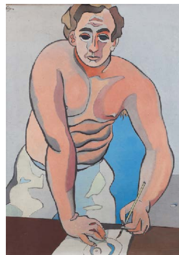
Jean HELION (1904-1987) Autoportrait de l'artiste dessinant Huile sur toile. Estimation : 60 000 - 90 000 €