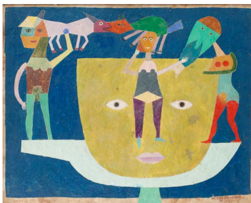
Victor BRAUNER (1903-1966) Bataille des médiums , 1960 Huile et encaustique sur isorel. Estimation : 80 000 - 100 000 €