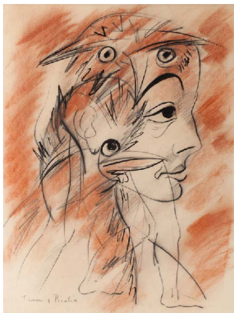
Francis PICABIA (1879-1953) Transparence (hibou, cacatoès, visage) Fusain, encre et sanguine. Estimation : 40 000 - 60 000 €