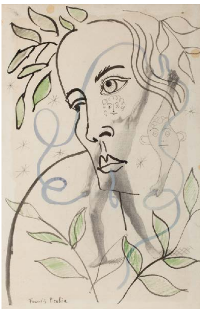
Francis PICABIA (1879-1953) Transparence , circa 1930 Aquarelle, encre et crayon sur papier. Estimation : 40 000 - 60 000 €