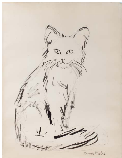
Francis PICABIA (1879-1953) Le chat Crayon et encre. Estimation : 8 000 - 12 000 €