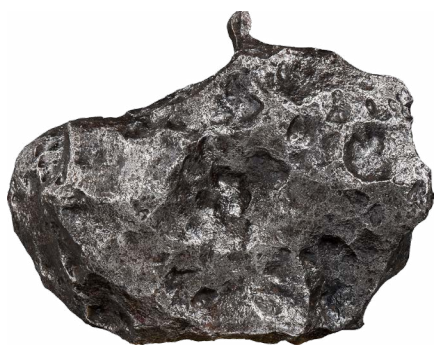
Météorite pesant 36 kg Campo del Cielo, Argentine Estimation : 12 000 - 15 000 €

Soigneusement préparé par une équipe de paléontologues italiens, le spécimen de cette vente est présenté la tête tournée vers le côté, probablement alerté par la présence d'un prédateur, peut-être allosaurus .