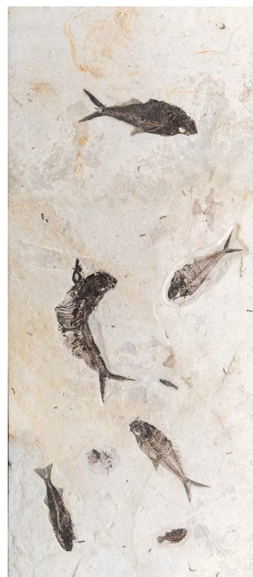
Plaque de poissons fossiles Formation de la Green River Kemmerer, Wyoming, États-Unis Eocène (-53 à -48 millions d'années) Estimation : 12 000 - 15 000 €

VENTE AUX ENCHÈRES PUBLIQUE - DROUOT - SALLES 5 ET 6