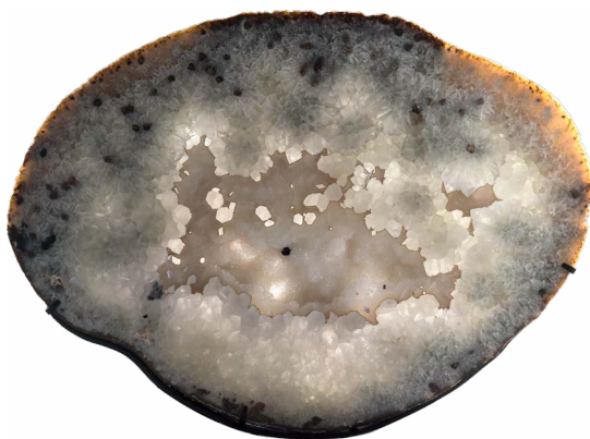
Rare tranche d'agate mesurant 82,7 x 113 cm Estimation : 26 000 - 28 000 €