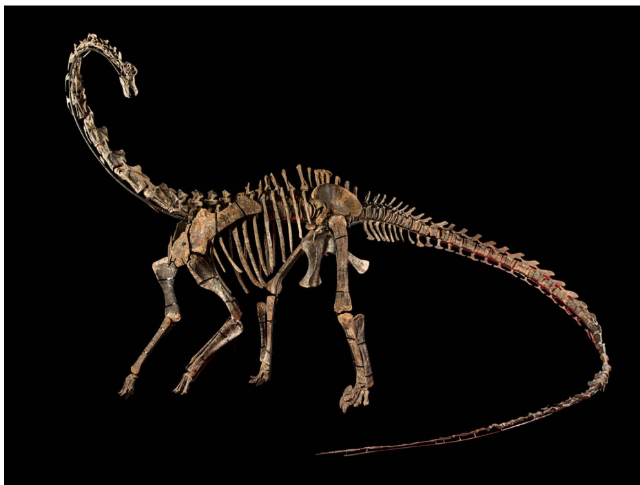
Diplodocus. Estimation : 450 000 - 550 000 €

L'herbivore vivait à la fin du jurassique, il y a 150 à 147 millions d'années, dans la zone ouest de l'Amérique du Nord. Les fréquentes découvertes d'os en font l'un des dinosaures les mieux connus.