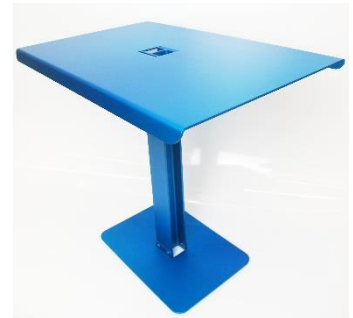
Coffee Table « PiMP », édition limitée, 2007, en aluminium anodisé bleu turquoise. Don de Didier et Clémence Krzentowski