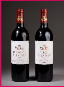
2 bouteilles de Les Forts de Latour 1997. Don de Patricia Barbizet